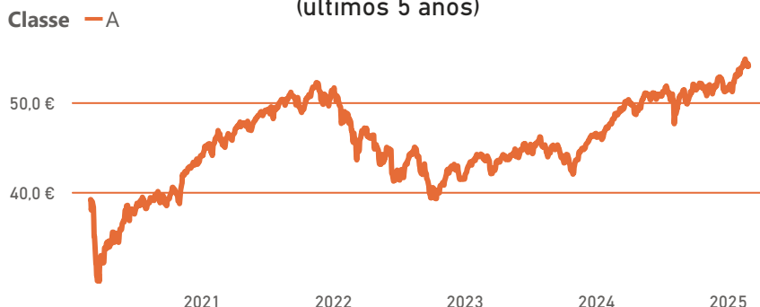
Rentabilidade Anualizada (%) em 28-02-2025